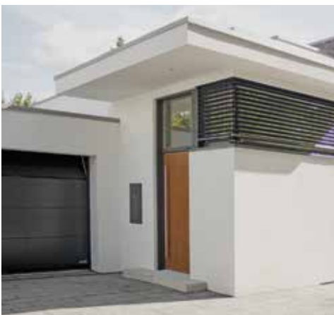
Wfl. 187,55 m 2