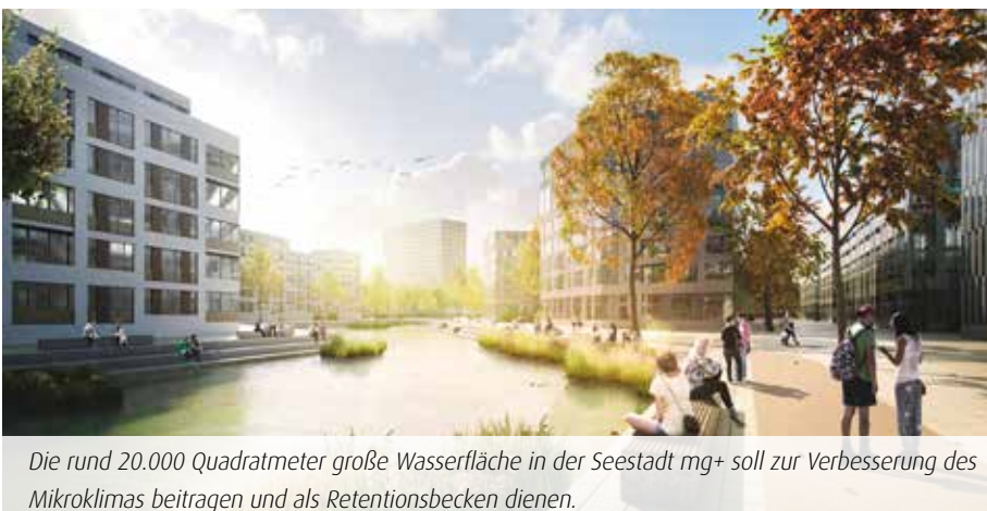
Die rund 20.000 Quadratmeter große Wasserfläche in der Seestadt mg+ soll zur Verbesserung des Mikroklimas beitragen und als Retentionsbecken dienen.

In Mönchengladbach ist mit der Erteilung der ersten Baugenehmigung nun der Weg frei für die neue 15-Minuten-Stadt, wo Unternehmen sich ansiedeln, bezahlbarer Wohnungsbau entsteht und Menschen künftig am See flanieren können. Mit 248 Wohnungen im Südviertel der Seestadt mg+ geht es los, davon sind 90 preisgebundene Wohnungen. Gewerbliche Nutzungen sollen in Kürze folgen. Die erste Genehmigung wurde nur einen Monat nach dem Beschluss zum Bebauungsplan erteilt – rekordverdächtig, wie auch Klaus Franken weiß: „Gemeinsam haben wir im engen Austausch und zuweilen harten Ringen mit der Stadtverwaltung etwas Großartiges geschaffen.“ Für den Anfang November aus dem Amt geschiedenen Oberbürgermeister Hans Wilhelm Reiners