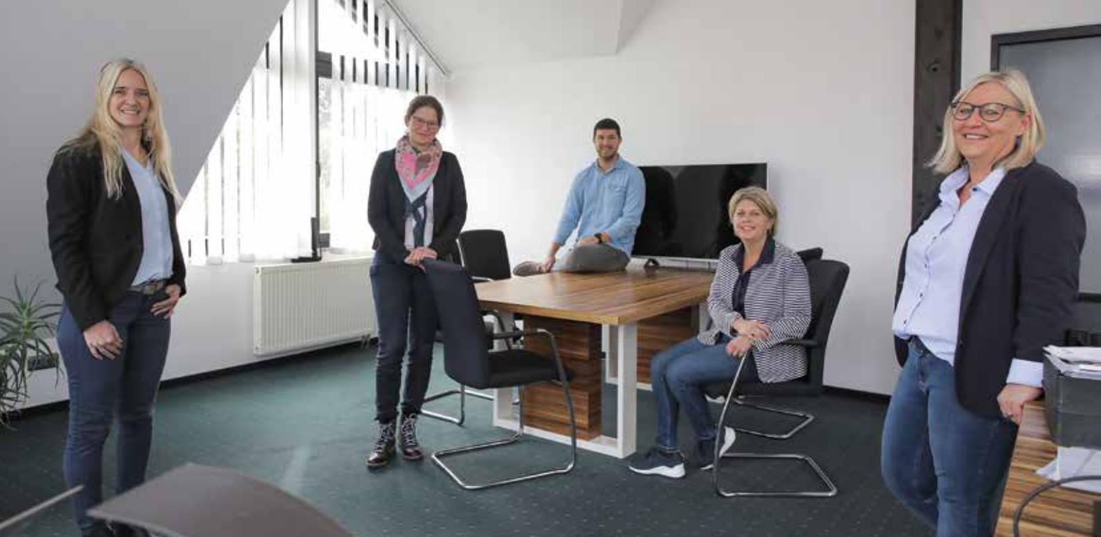
Das Team der Steuerberatungskanzlei Kogge hilft, die Digitalisierung der Prozesse bei ihren Kunden voranzutreiben.