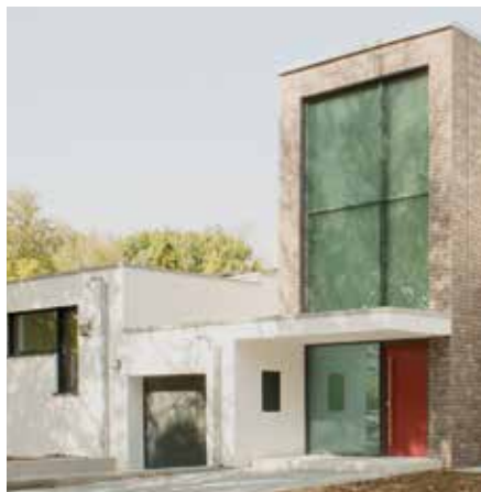
Wfl. 145,25 m 2