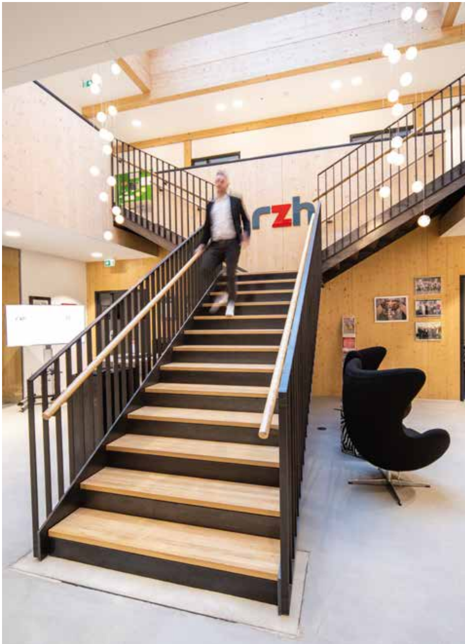
Der neue Firmensitz von RZH an der Pescher Straße ist das erste zweigeschossige Holzgebäude der Stadt.