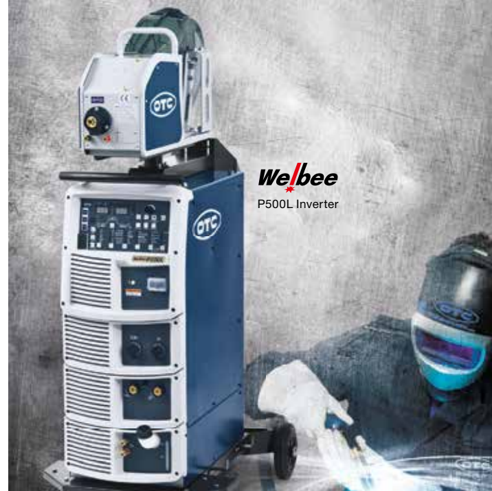
Welbee P500L Inverter