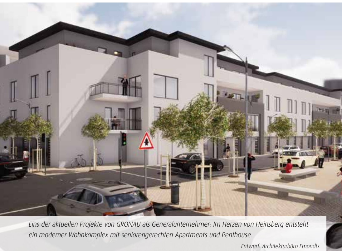
Eins der aktuellen Projekte von GRONAU als Generalunternehmer: Im Herzen von Heinsberg entsteht ein moderner Wohnkomplex mit seniorenrechtlichen Apartments und Penthouse.

neten die Wegberger unter anderem für die ersten Bauabschnitte beim Hallenneubau des Gladbacher Stahlunternehmens Reimann verantwortlich. Für REWE, mit rund 3.300 Märkten der zweitgrößte Lebensmittel-einzelhändler in Deutschland, hat GRONAU bereits etliche Großprojekte in der Region realisiert. „Mit unserem Portfolio sind wir