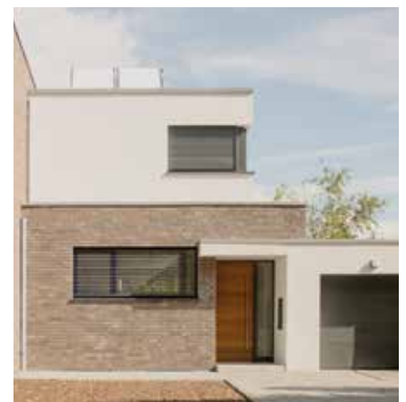
Wfl. 202,38 m 2

Drei autarke, bezugsfertige* Wohneinheiten inklusive Garage, Garten- & Außenanlagen und Grundstück.