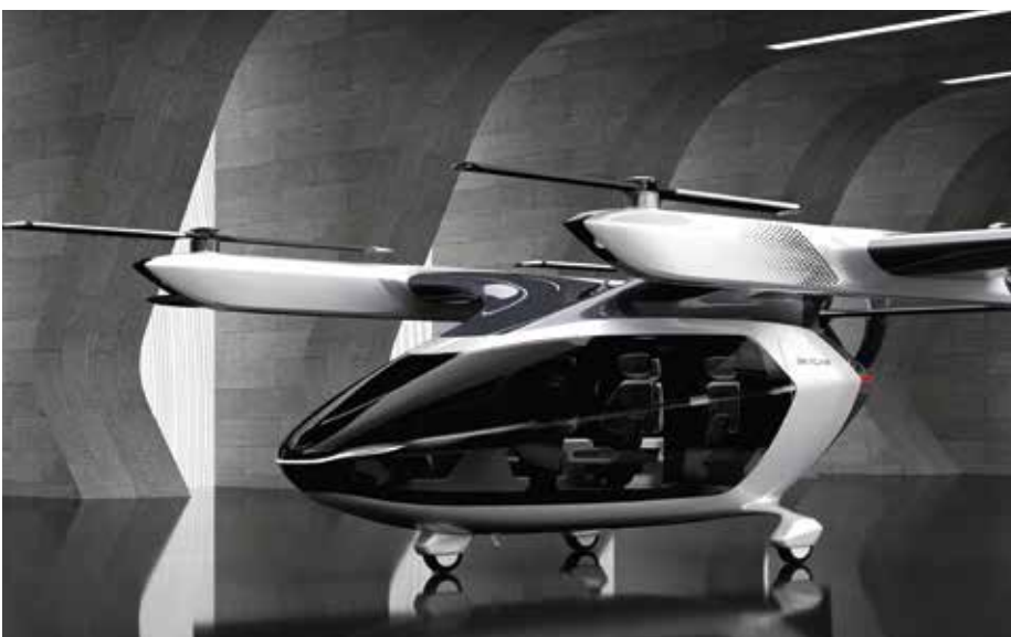
Das Lufttaxi „SkyCab“ soll später auf dem Flughafengelände in Mönchengladbach getestet werden.

Schon immer waren Mönchengladbach und sein Flughafen Keimzelle für Innovationen. Einer der größten Technik- und Luftfahrtpioniere Deutschlands, Hugo Junkers, wurde am 3. Februar 1859 in Rheydt geboren. Eine seiner wohl berühmtesten Flugzeuge, eine Ju52, verleiht heute dem Hugo-Junkers-Hangar, der besonderen Eventlocation am MGL, sein besonderes Flair. Rund 100 Jahre später setzt die Rhein Flugzeugbau mit dem ersten in Serie gefertigten Leichtflugzeug RW-3 am Flugplatz MGL innovative Akzente. Und heute wird hier mit der SkyCab-Forschung zu Lufttaxen ein ganz neues Verkehrs- und Mobilitätssystem definiert.