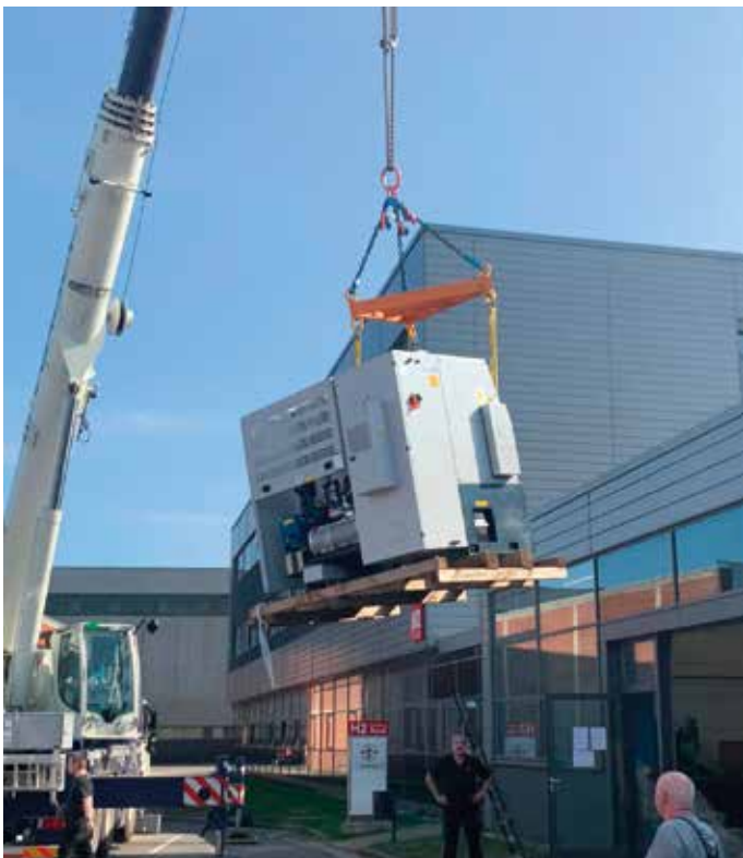
Kommt eine Maschine geflogen: Die neuen Maschinen garantieren eine Ausbildung auf höchstem Niveau – auch in Zukunft.